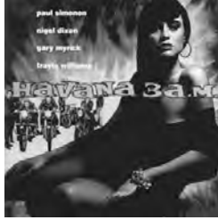
Paul Simonon'un Havana 3 a.m. grubuyla yaptığı ilk albümünün kapağı

söz ettirmeye başladı. 1948 yılında Meksika'ya göç eden Prado, burada kendi orkestrasını kurdu ve RCA şirketiyle anlaşarak art arda albümler kaydetmeye başladı. Dönemin ünlü aranjörlerinden Sonny Burke'ün Meksika'dayken "Qué Rico Mambo"yu duymasıyla birlikte Prado'nun kendini ABD'de bulması bir oldu. Burke'ün bu şarkıyı yeniden düzenleyerek "Mambo Jambo" adıyla ABD'de meşhur etmesinden sonra Pérez Prado, dönemin sanatçıları gibi soluğu ABD'de aldı, konserleri dolup taşı. Rumbanın, Prado'nun sözleriyle, "daha ahenkli ve oynak olan" bir başka biçimi mambo, böylece Latin çevrelerinden çıkıp beyaz ABD'yi de kuşattı. (ABD'nin mamboyla tanışmasının Prado'yu önceleyen Kübalı Katalan Xavier Cugat'la gerçekleştirdiğini savunan görüşler de vardır.) Prado dans pistleriyle sınırlı kalmayıp sinema filmlerinde de izleyici karşısına çıktı. Ağırıklı olarak Meksika filmlerinde oynadı, Amerikan filmlerinde de boy gösterdi. 1955'te mambo zirve noktasındayken Louiguy'in "Cherry Pink (and Apple Blossom White)" şarkısını alıp yorumladı ve unutulmaz mambo klasikleri arasına soktu, şarkı ABD'de uzun süre listelerin tepesinden inemedi. 1960'lı yıllarda dipten gelen dalga rock'n'roll ve pop bütün dünyayı dört bir yandan sarınca Pérez Prado önce