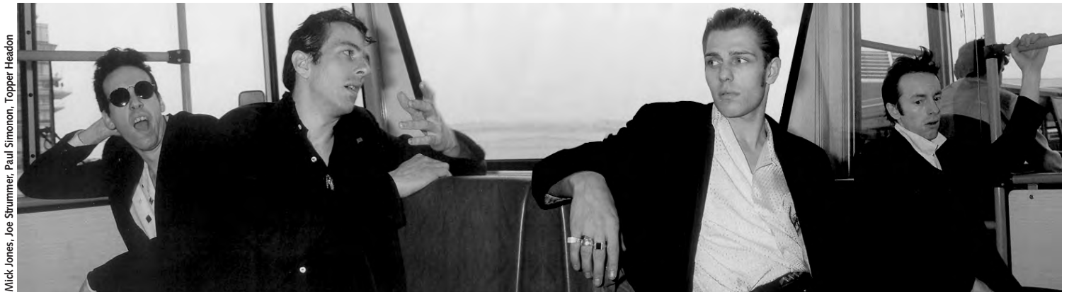
Mick Jones, Joe Strummer, Paul Simonon, Topper Headon