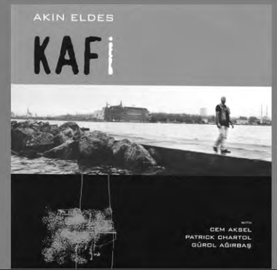
Akın Eldes Kafı