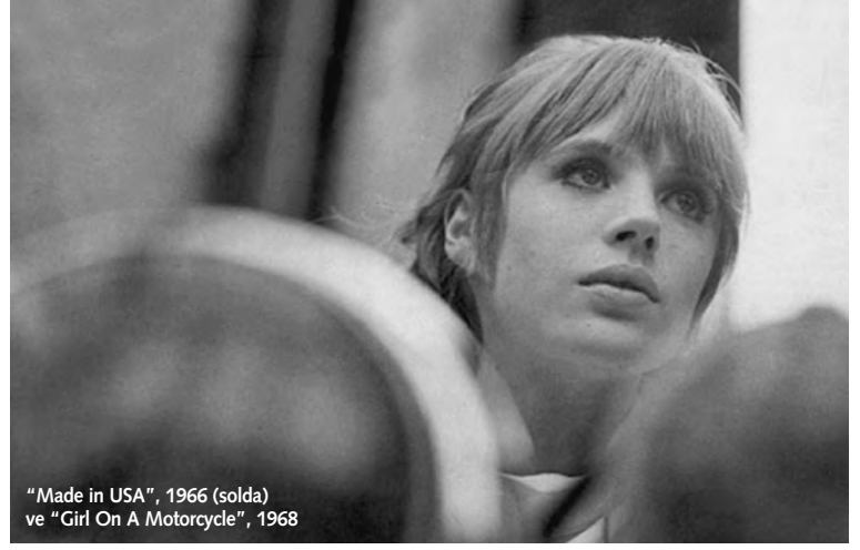
"Made in USA", 1966 (solda) ve "Girl On A Motorcycle", 1968

madan uzaklaştırdı. Bu nedenle de setlere ancak Patrice Chéreau'nun "Intimacy" (Mahremiyet) filmiyle dönebildim; o bana tekrar sinema sevgisi aşıladı ve kariyerimin yeniden doğmasını sağladı bir anlamda. Chéreau mükemmel bir oyuncu yönetmeni. Kameranın müttefikim olabileceğini öğretti bana. Bugün eğer bir anlamda oyuncuysam, bunu tamamen ona borçluyum.