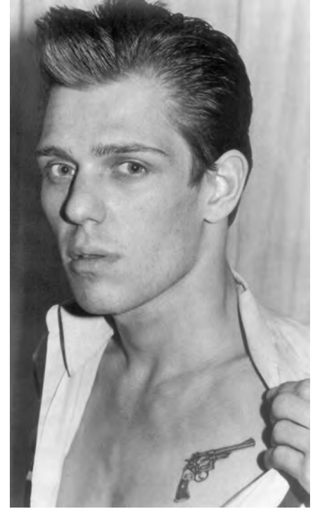
Şarkının yazarı Paul Simonon, Clash günlerinde, silah dövmesiyle

Ezebilirsiniz bizi Tepeleyebilirsiniz bizi Cevap vereceksiniz ama Brixton silahlarına