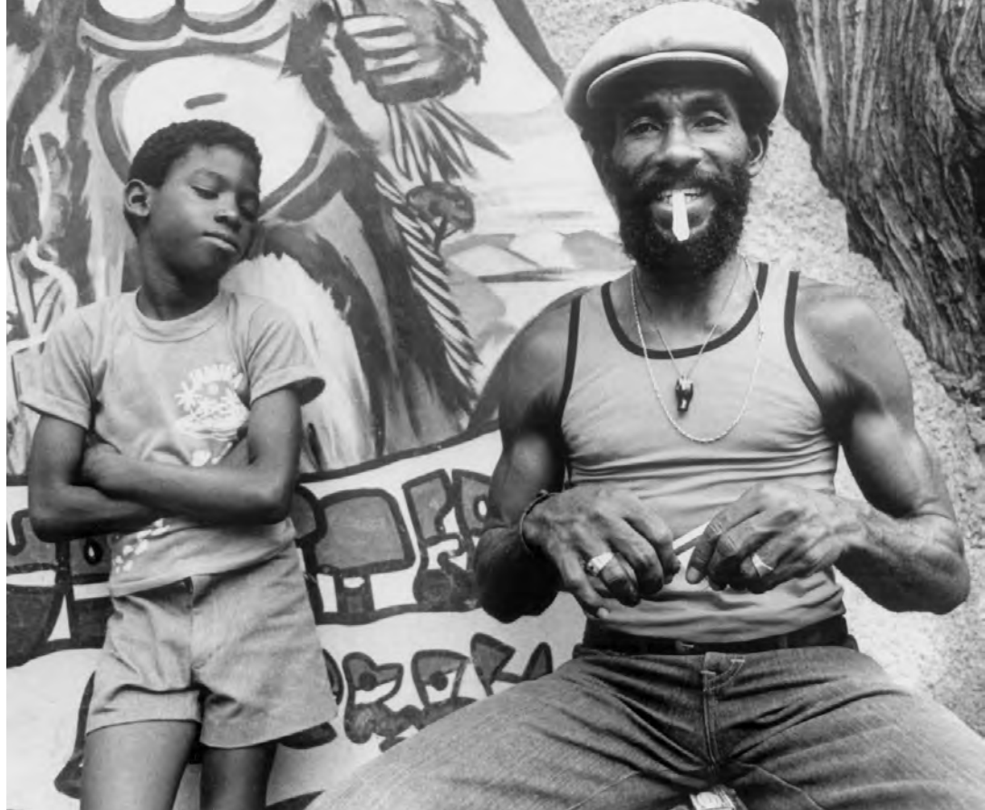
Dub ve reggae'nin öncü isimlerinden Lee "Scratch" Perry bugün 71 yaşında ve İsviçre'de yaşıyor

Reggae, dub, debstep, drum & bass, jungle gibi sistemde çalınacak olan müzikler, melodinin başta yürüdüğü müzik türleridir. İnsan kulağı bas frekanslarını duymaya elverişli değildir, orta ve yüksek (mid ve tiz) frekansta seslere yatkındır. Bu yüzden bas frekanslarda çok yüksek güç ve hassasiyet ile insan kulağındaki bu duyum farkı ortadan kaldırılabılır. Bu bilgi gözönüne alınarak tasarlanmış ses sistemlerinde farklı tarzlardaki müzikler farklı konfigürasyonlara ihtiyaç duyar. Özellikle basın ağırlıklı olduğu müziklerde bas kabinlerinin ve hoparlör içlerinin çok güçlü ve hassas olması gerekir. Türkiye'de kullanılan sub-bass hoparlörleri, 50 Hz'ye kadar başarılı ses verebilir. Ancak reggae için özel olarak tasarlanan scoop kabin dizaynı ve amaca uygun bir hoparlör içiyle, reggae müzikte ihtiyaç duyulan 30-50 Hz aralığı uygun şekilde dinlenebilir. 30-50 Hz aralığı, profesyonel sistemlerde veya bir ev sisteminde duyurulması en zor frekans aralığıdır. Bu yüzden çoğu kişinin müzikte bu frekans aralığını hayatı boyunca duymamış olma olasılığı yüksektir. Avrupa'da ve özellikle de İngiltere'de reggae ve dub, 1950'lerden beri bu tür ses sistemleriyle çalınıyor. 1980'lerden sonra elektronik müziğin bazı kollarının da bas yoğunluklu olmasıyla beraber bu tür ses sistemlerinin popülaritesi arttı ve neredeyse bütün şehir ve kasabalarda eğlence dünyasının bir parçası haline geldi.