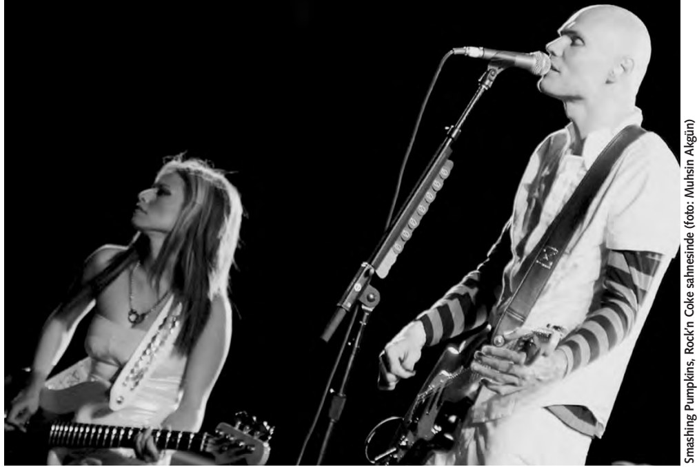
Smashing Pumpkins, Rock'n Coke sahnesinde

Müzik basınından günbegün izlediğimiz bu albüm yapım süreciyle birlikte, nihai ürün de sonunda çıkageldi... Ön kapakta, yarı beline kadar denize gömülmüş Özgürlük Heykeli, üstünde kara bulutlar, arkada doğan bir güneş... Arka kapakta, ABD bayrağından bozma bir SP bayrağı, şarkı listesinde "Doomsday Clock", "United States", "For God And Country"