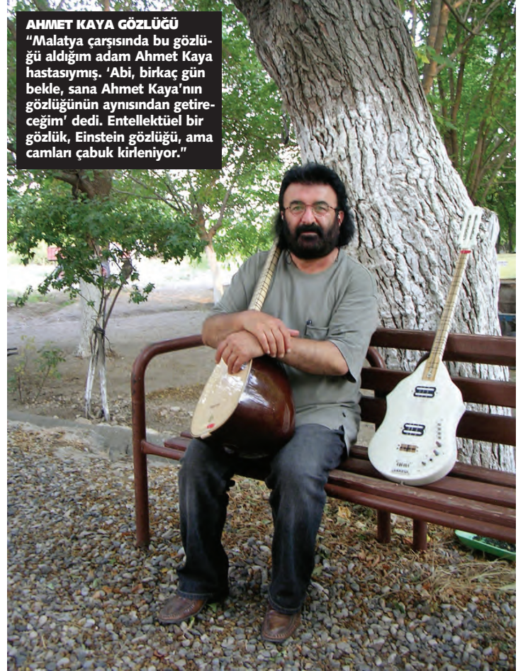
AHMET KAYA GÖZLÜĞÜ "Malatya çarşısında bu gözlüğü aldığım adam Ahmet Kaya hastasıymış. 'Abi, birkaç gün bekle, sana Ahmet Kaya'nın gözlüğünün aynısından getireceğim' dedi. Entelektüel bir gözlük, Einstein gözlüğü, ama camları çabuk kirleniyor."

"Helmut diyor pis yabancı / Turgut diyor Alamancı / Bir gün çekip gitsen burdan / İşe alır mı Sabancı?" demişiz "Avrupa'da Çöpçüyüm Ben"