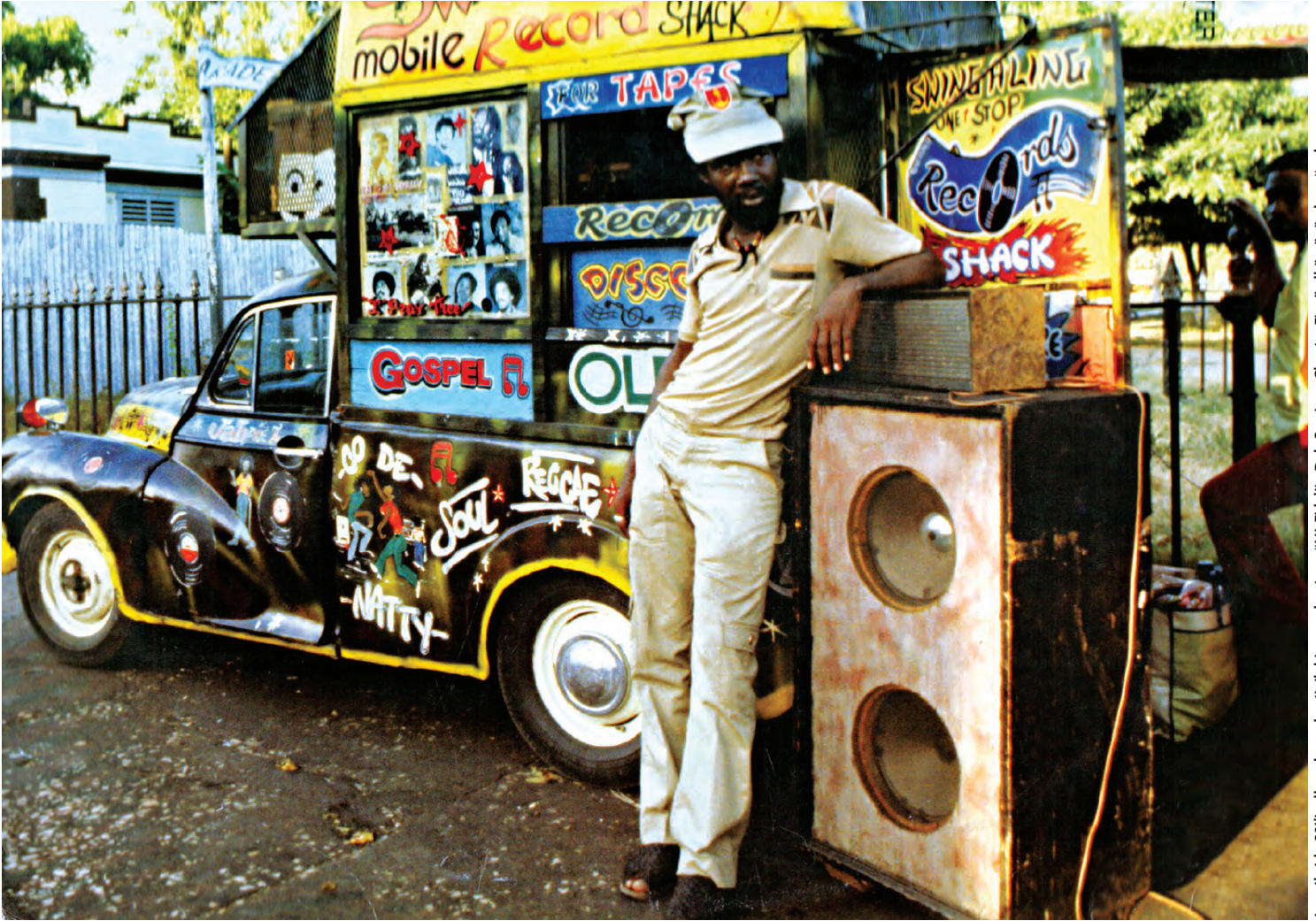
Jamaika'da 80'li yılların başından tipik bir soundsystem, "Hi-Fidelity Dub Sessions Chapter Five" albümünün kapagından

stüdyoda Tubby şarkılarla oynayarak ve yenilikçi stiliyle hiç duyulmamış efektleri birleştirerek yepyeni versiyonlar yarattı. Tubby, kestiği dubplate'lerin bazılarını plak olarak piyasaya sürerken, bazılarını özel versiyonlar halinde sadece kendi soundsystem'inde çalıyordu. Sonrasında bu bir gelenek haline geldi ve özgün dubplate'ler, soundsystem'leri tarz açısından eşsiz, dans açısından kaçınılmaz bir deneyim olarak şekillendirdi. Jamaika müziğine önemli katkılarda bulunan isimlerden biri de Augustos Pablo'dur. Melodikayı müziğinin ayrılmaz bir parçası haline getiren sanatçının etkisi, günümüz reggae ve dub'ına da sıçramış durumda. Rockers isimli soundsystem'in sahibi olan Pablo ile "dub dehası" King Tubby'nin ortak çalışması "King Tubby Meets Rockers Uptown", sadece türün sevenlerini değil, drum'n'bass DJ'lerini de derinden etkilemiş bir çalışma.