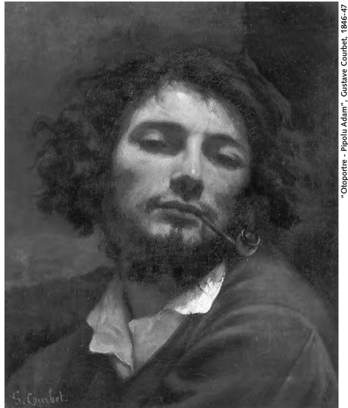
“Otoportre - Pipolu Adam”, Gustave Courbet, 1846-47

T.J. Clark'ın “Image of The People: Gustave Courbet and The 1848 Revolution”ından roll'layan: Y.G.