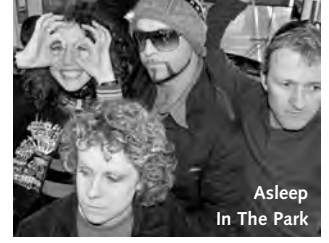
Asleep In The Park