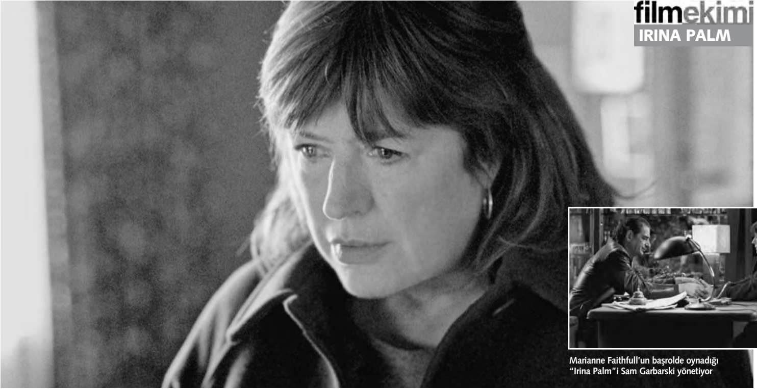
Marianne Faithfull'un başrolde oynadığı "Irina Palm"i Sam Garbarski yönetiyor