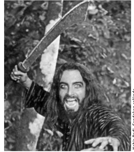
Kabir Bedi, Sandokan rolünde

ler içinde en kalıcı iz bırakan, 1883'te "Mompacem'in Kaplanları"yla başlayan ve 1913'te ölümünden sonra yayınlanan "Yanez'in İntikamı"yla son bulan on kitaplık "Sandokan" serisiydi: 1960'larda sinemaya, 1970'lerde ve 1990'larda televizyona dizi ve çizgi film olarak uyarlandı. Mompacem adlı hayali adanın bağımsızlığı için savaşan Sandokan ve yoldaşı Yanez de Gomera'nın maceraları spaghetti western'in babası Sergio Leone'ye de esin kaynağı olmuştur. Sandokan'ın Hindistan'ın Cüneyt Arkin'i Kabir Bedi tarafından canlandırıldığı TV dizisi TRT'de de gösterilmiştir.