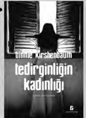
TEDİRGİNLİĞİN KADINLIĞI Binnie Kirshenbaum