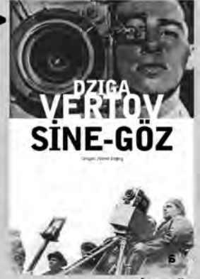
SİNE-GÖZ Dziga Vertov