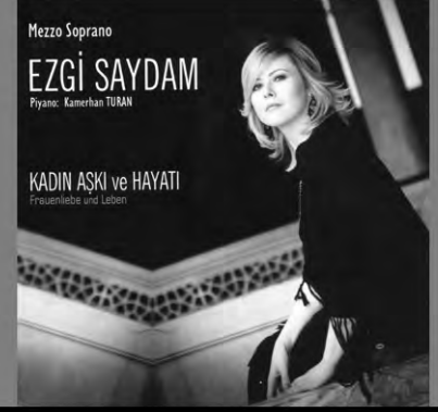
Ezgi Saydam Kadın Aşkı Ve Hayatı