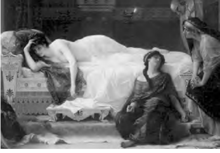
"Phaedra", Alexandre Cabanel, 1880