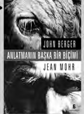
ANLATMANIN BAŞKA BİR BİÇİMİ John Berger - Jean Mohr