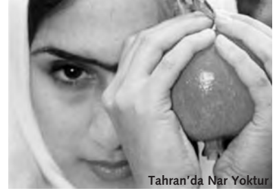
Tahrân'da Nar Yoktur