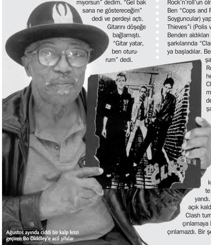
Ağustos ayında ciddi bir kalp krizi geçiren Bo Diddley'e acil şifalar

Gitarını döşeğe bağlamıştı. "Gitar yatar, ben otururum" dedi.